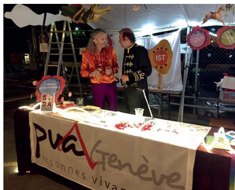
Le stand PVA à la soirée 360° Fever «Houdini et les 40 jongleurs» 24 juin 2017, Fonderie Kugler.

A mener le message de prévention au VIH et aux IST ainsi que lutter contre les discriminations, sont deux des buts principaux de notre association.