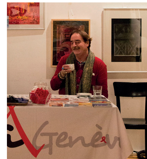
Le Stand de prévention de PVA-Genève au GALPON du 2 au 10 décembre 2017.

DEVIENS TOI AUSSI BÉNÉVOLE POUR LA PRÉVENTION !