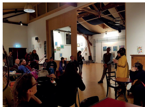
Vernissage de l'exposition «25 de lutte en couleur» - les oeuvres de la peinture thérapeutique de PVA-Genève, 2 déc.17.