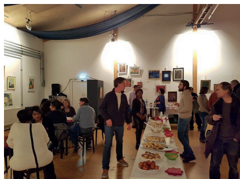
Finissage de l'exposition «25 de lutte en couleur» - les oeuvres de la peinture thérapeutique de PVA-Genève, 9 déc.17.