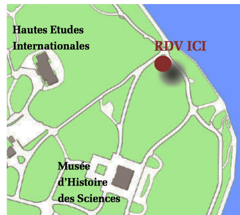
Lieu de RDV - Parc de la Perle du Lac

Rendez-vous le lundi 31 août dès 16h à la Perle du Lac pour célébrer ensemble la rentrée de PVA-Genève !